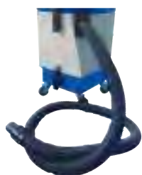
Tubo flessibile da 3 mt. Ø 38 3mt hose Ø 38