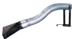
Cappetta aspirante con flessibile e supporto magnetico Suction hood with flex and magnetic support