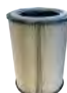
Class M Cartuccia PTFE con carbone attivo PTFE cartridges with activated carbon