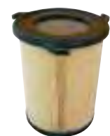
Cartuccia in cellulosa Cellulose cartridges